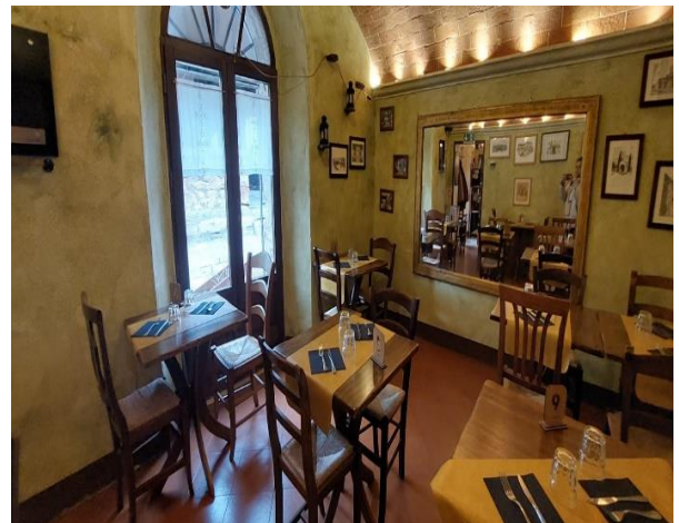
34 tavoli e sedie

Progetto realizzato con il contributo della