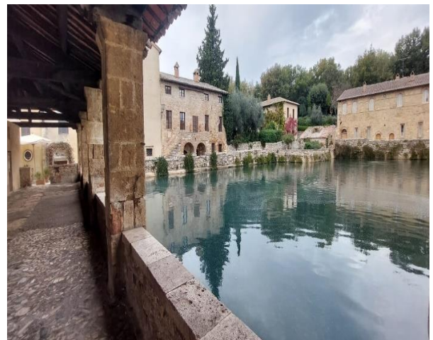
19 Interno loggiato e vasca termale

Progetto realizzato con il contributo della