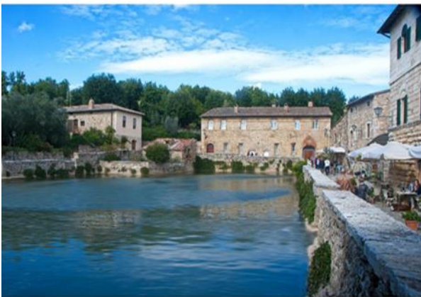
28 Percorso costeggiante la vasca