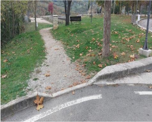
Figura 7 Percorso in ghiaia