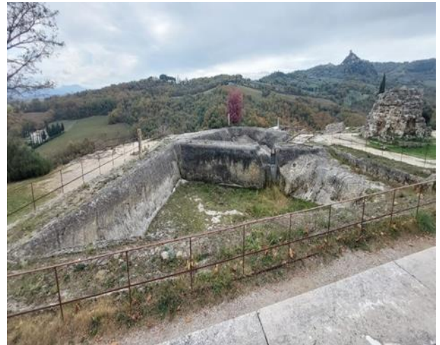
10 Vasche comunicanti tra loro tramite fenditura