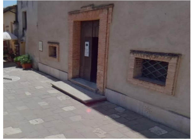
23 Portale di ingresso con scalini