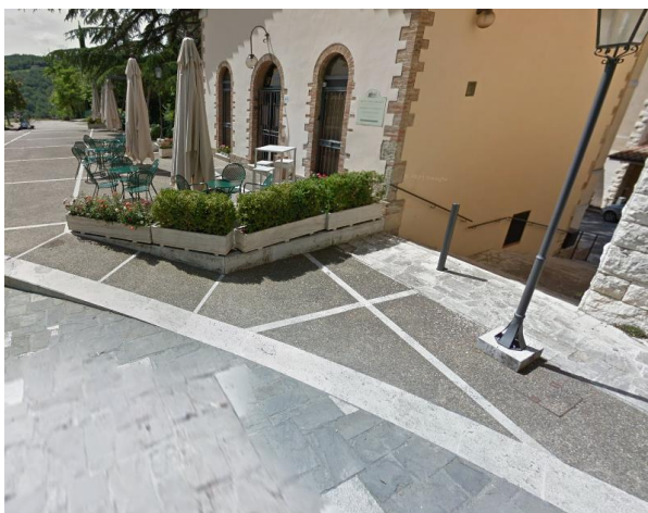
5 Saliscendi del marciapiede