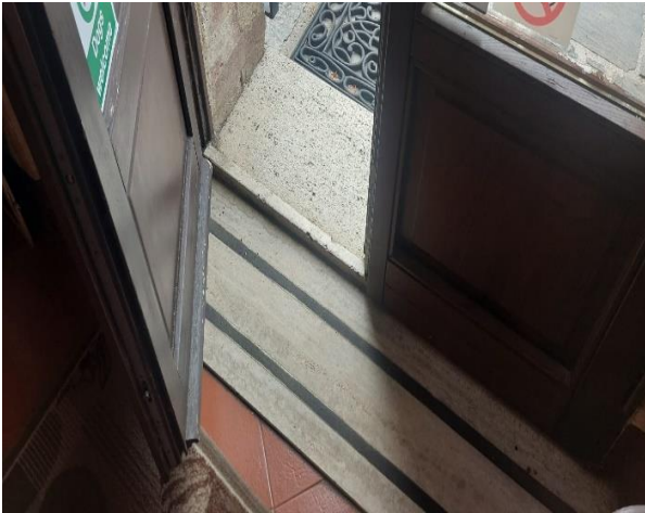
24 Gradino soglia della porta di ingresso della chiesa