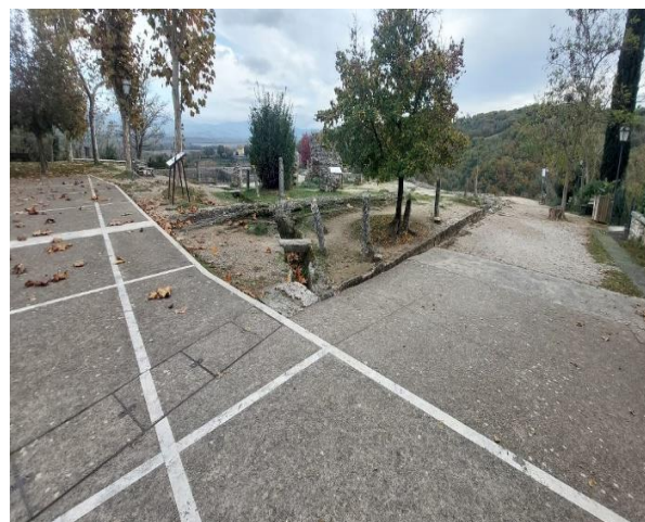
6 Piazza del Parco dei Mulini

Le due grandi vasche interamente scavate nel travertino e tra loro comunicanti tramite una fenditura alimentavano il molino per mezzo di un condotto a forma di cono rovesciato che si restringeva per ottenere un getto ad alta pressione diretta sulle ruote motrici del mulino. Un sentiero in ghiaia, non consigliato alle persone con disabilità, permette di vedere più da vicino le vasche, ben visibili comunque anche dalla terrazza