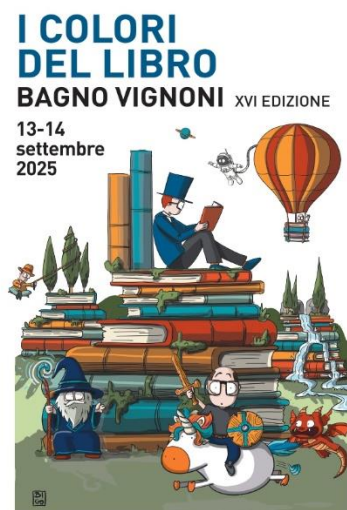
30 Locandina tipica di un evento