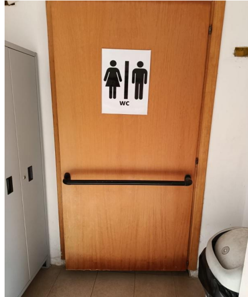
36 Porta interna