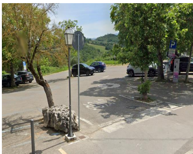
1 ingresso parcheggio principale