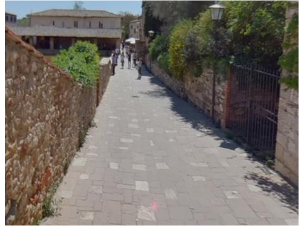
27 Rettilineo con pendenza del 5%