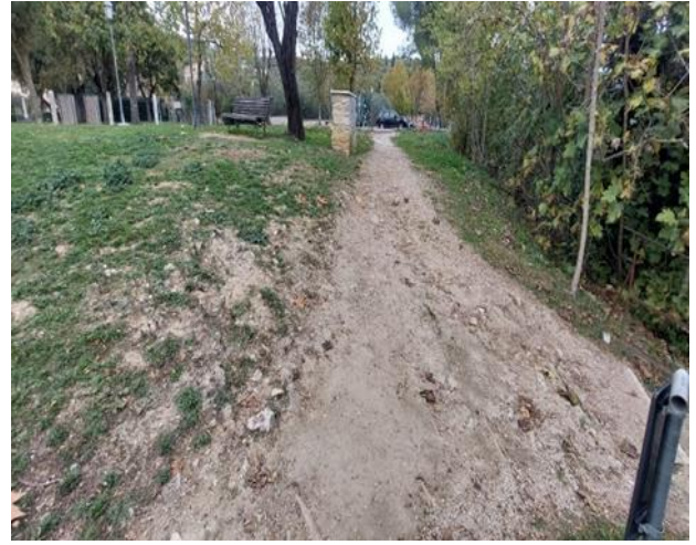
Figura 9 Rampa irregolare e con ciottoli