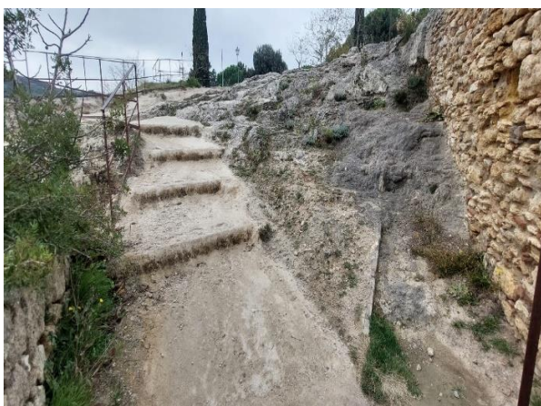
14 Scalini e avvallamenti in pietra