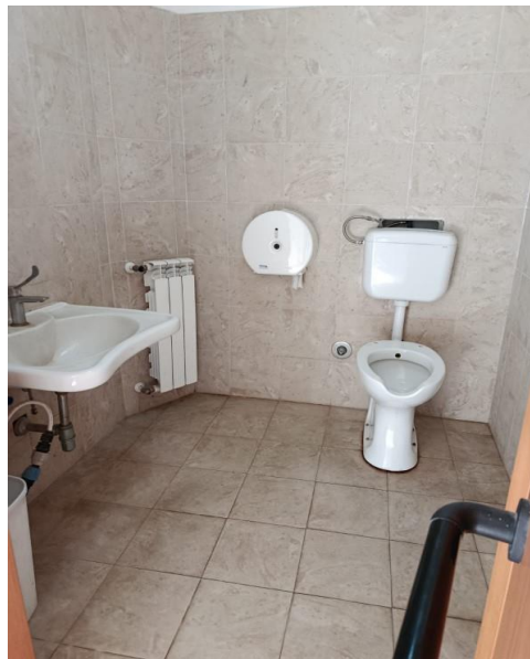
37 Wc e lavabo

Progetto realizzato con il contributo della