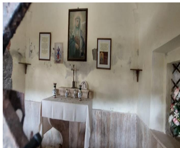
21 Interno Cappella

Per proseguire il percorso, si ritorna indietro verso il varco di ingresso del loggiato dove a pochi metri sul lato sinistro si incontra la Chiesa di San Giovanni Battista . La chiesa fu edificata tra il XII e il XIII secolo in epoca romanica. La facciata si presenta a capanna, intonacata con portali e finestre in laterizio. All'interno un corridoio centrale ampio e su pavimentazione liscia, permette di visitare la semplice chiesa a navata unica.