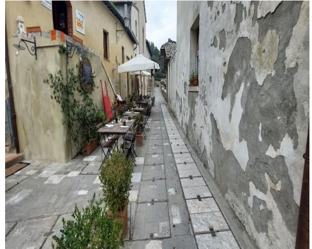
17 Percorso privo di ostacoli