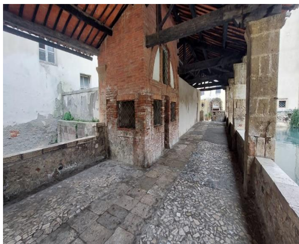
20 Facciata della piccola Cappella