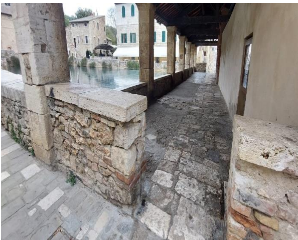
18 Varco ingresso del loggiato