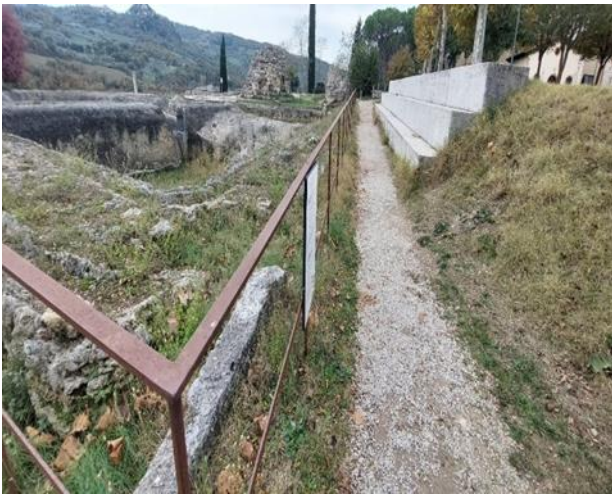
8 Proseguimento sentiero in ghiaia, adiacente le vasche