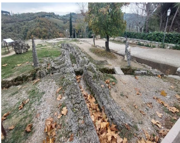
12 Rampa su pavimentazione in ghiaia