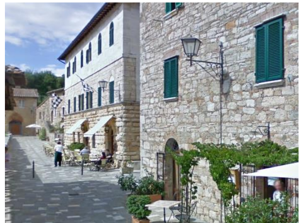
29 Palazzo Rossellino

Progetto realizzato con il contributo della