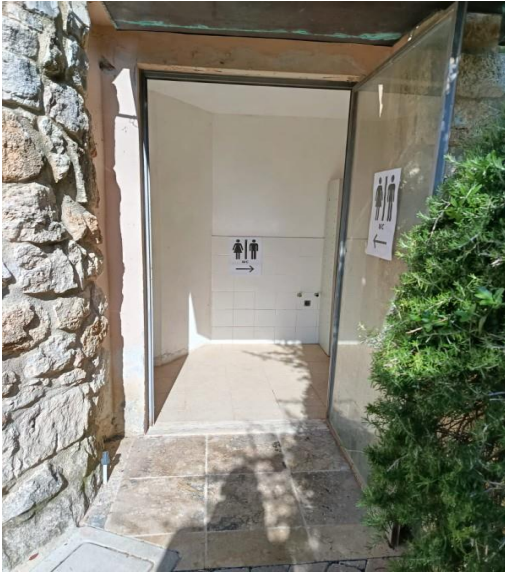
35 Porta esterna