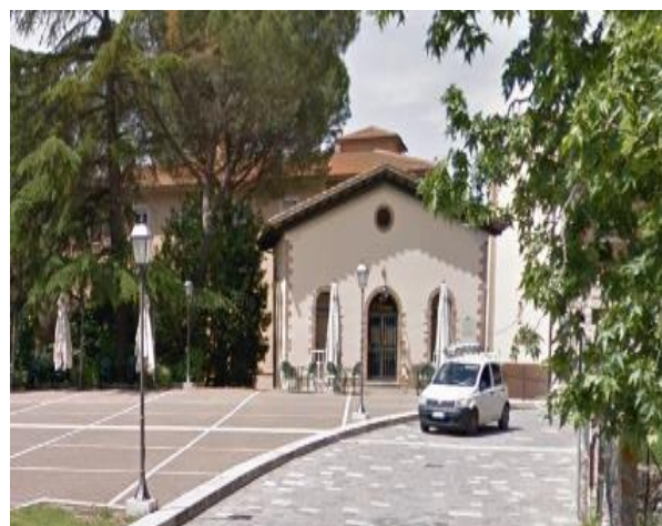
4 Ingresso Hotel Posta Marcucci