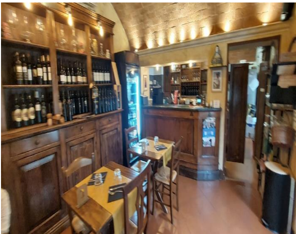
33 interno Ristorante