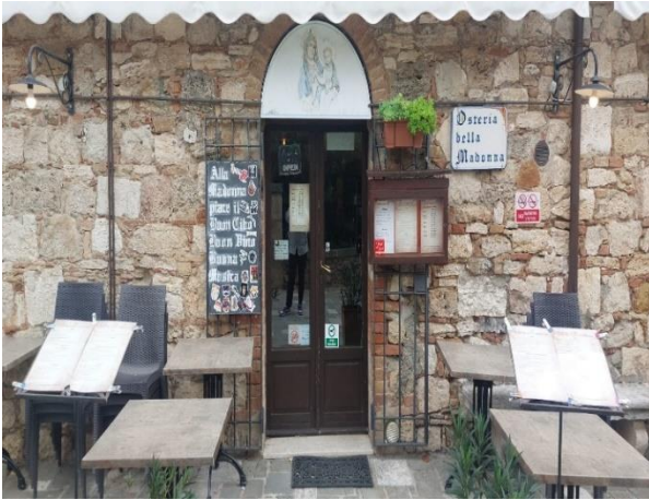
31 Ingresso Ristorante