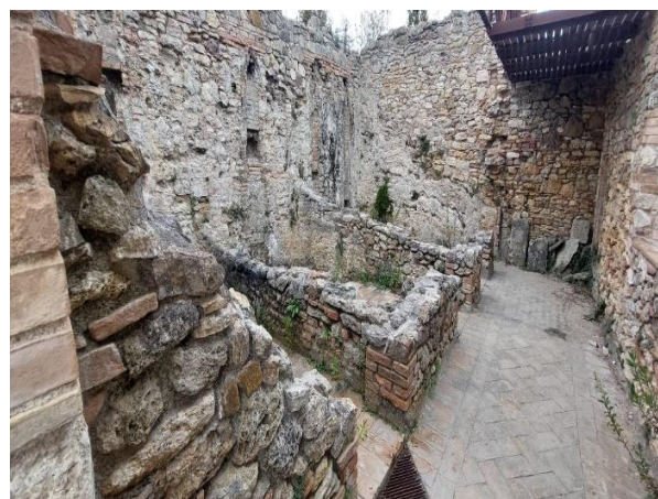
15 Interno Torre

Dal Parco si prosegue verso Via del Gorello fino ad arrivare a Piazza del Moretto dove si trova il vecchio edificio dello Stabilimento termale . Oltrepassato l'edificio, dopo pochi metri sulla nostra destra, troviamo l'ingresso dell'antico loggiato, con la vasca termale e simbolo del luogo. All'interno della vasca sgorga la sorgente naturale di acqua termale che dopo aver percorso un tratto sottoterra riemerge nei gorelli del Parco dei Mulini. La vasca è caratterizzata da un loggiato e si presenta in forma rettangolare. Misura 49 metri di lunghezza e 29 di larghezza, ed ha un getto d'acqua termale, che un tempo sgorgava