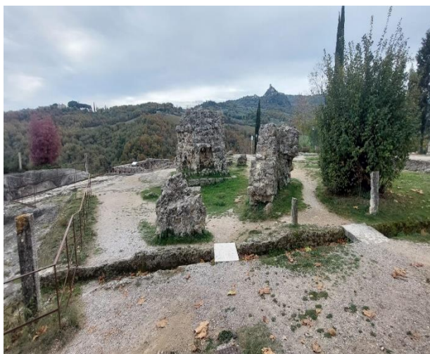
11 Parco dei Mulini

Dal lato dell'hotel si trova un'altra rampa che ci permette di vedere l'area dalla parte laterale. Da qui parte un percorso in ghiaia battuta in parte irregolare che ci conduce fino al retro del parco da dove si può ammirare il panorama e parte degli edifici che formavano il complesso tra cui la torre.