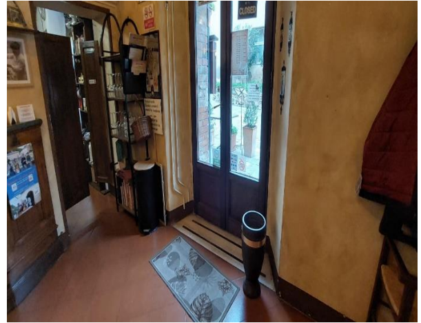
32 Rampa e scalino