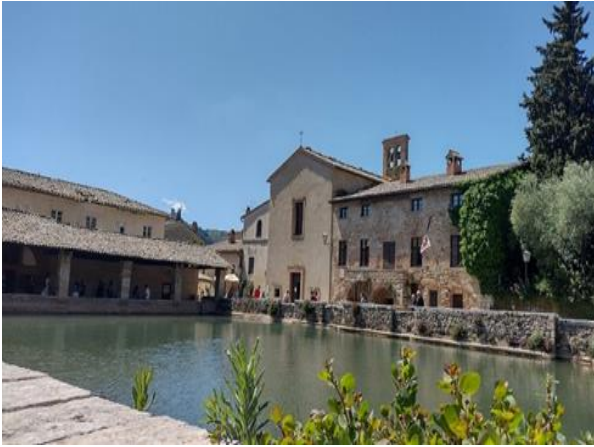
22 Chiesa San Giovanni Battista