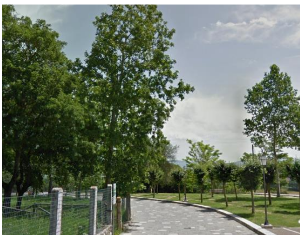
3 Percorso da parcheggio a Parco dei Mulini

Poco più avanti di fronte all'ingresso della struttura ricettiva "l'Hotel Posta Marcucci" una piccola rampa che ci permette di entrare nella piazza. La rampa presenta una larghezza di 140 cm, una lunghezza di 230 cm e una pendenza del 7%. La rampa non presenta corrimani ai lati.