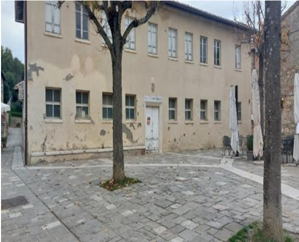
16 Antico stabilimento balneare